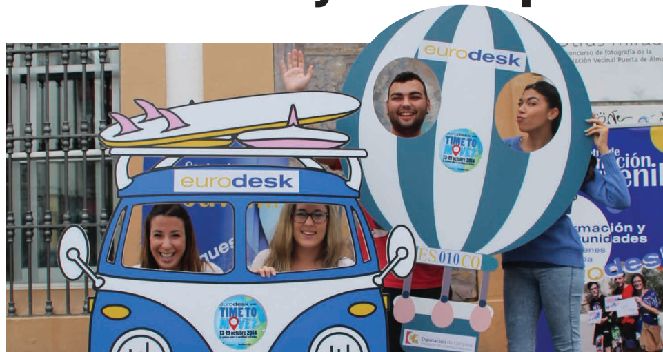
Uczestnicy wydarzeń zorganizowanych w ramach kampanii Time to Move w hiszpańskiej Cordobie

P onad 1100 warsztatów i prezentacji dla ponad 60 tys. osób zorganizowali w ubiegłym roku pracownicy sieci Eurodesk. Znaleźli też czas, by odpowiedzieć na 258 tysięcy pytań i opracować publikacje, których nakład przekroczył milion egzemplarzy!