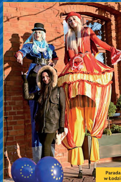
Parada w Łodzi

Nie dość, że sieć Eurodesk Polska po raz czwarty zorganizowała najwięcej eventów ze wszystkich krajów uczestniczących w kampanii Time to Move , to jeszcze pobiła swój własny rekord z ubiegłego roku, przeprowadzając 146 imprez w całej Polsce. I to jakich różnorodnych! Lekcje o wolontariacie, warsztaty o realizacji projektów młodzieżowych, gry miejskie, pikniki językowe, jam sessions, edukacyjne gry planszowe – dla każdego coś fajnego. W polskich wydarzeniach Time to Move uczestniczyło ponad 8 tys. osób. Dla tych, którzy nie wzięli udziału, mamy dobrą wiadomość – kolejna kampania Time to Move już za rok. Znowu rekordowa?