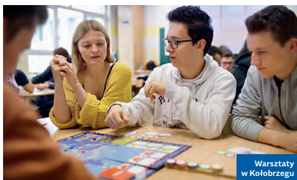
Warsztaty w Kołobrzegu