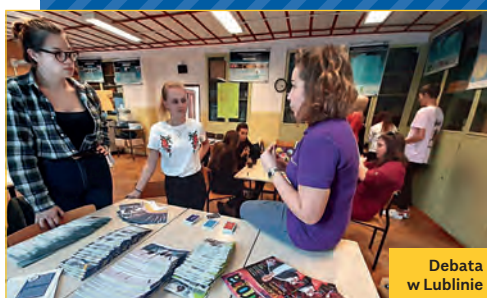
Debata w Lublinie

Nie dość, że sieć Eurodesk Polska po raz czwarty zorganizowała najwięcej eventów ze wszystkich krajów uczestniczących w kampanii Time to Move , to jeszcze pobiła swój własny rekord z ubiegłego roku, przeprowadzając 146 imprez w całej Polsce. I to jakich różnorodnych! Lekcje o wolontariacie, warsztaty o realizacji projektów młodzieżowych, gry miejskie, pikniki językowe, jam sessions, edukacyjne gry planszowe – dla każdego coś fajnego. W polskich wydarzeniach Time to Move uczestniczyło ponad 8 tys. osób. Dla tych, którzy nie wzięli udziału, mamy dobrą wiadomość – kolejna kampania Time to Move już za rok. Znowu rekordowa?