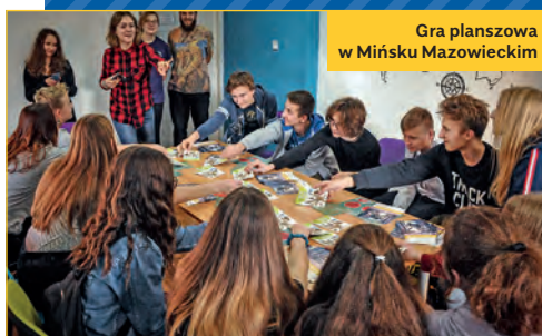
Gra planszowa w Mińsku Mazowieckim

Ponad 10 proc. wszystkich wydarzeń przeprowadzonych w ramach ogólnoeuropejskiej kampanii Time to Move odbyło się w Polsce.